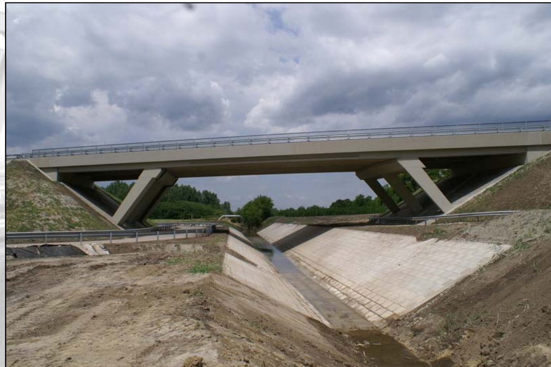
2. kép. Törtvonalú tartó II.

A feladatok megoldása során adott lesz a tartó tengelyvonala, valamint egy fix- és egy görgős támasz. E feladatoknál is célszerű a már korábbiaknak megfelelő módon kezdeni a számolást, azaz első lépésben