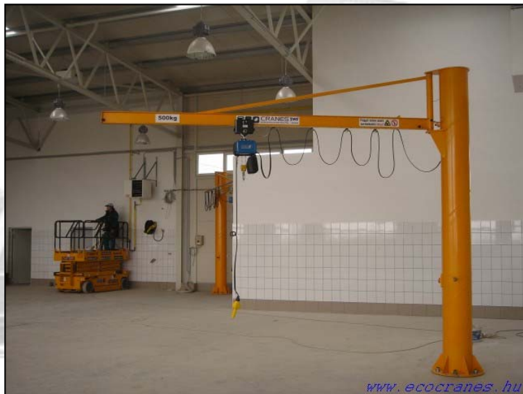
3. kép. Ágas tartó I.

Az ágas tartók olyan konzolosan befogott tartók, melyek tengelyvonala tört, illetve elágazó kialakítású. A konzolos tartók esetében elmondottak e feladatoknál is érvényesek.