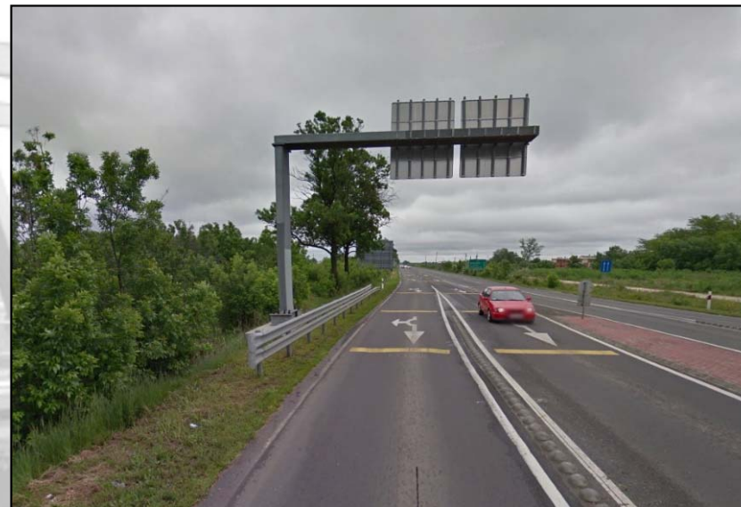
5. kép. Ágas tartó II.

A feladatok megoldása során adott lesz a tartó tengelyvonala, illetve a rögzítésére szolgáló befogás. Mindig szükséges a kiindulási adatok pontosítása (ferde erők felbontása olyan összetevőikre, hogy a nyomatéki egyenlethez szükséges erőkarokat egyértelműen le lehessen olvasni, valamint a megoszló terhelések koncentrált erőkké alakítása). Ezután következhet a befogási nyomaték és a támaszerők kiszámítása, a már