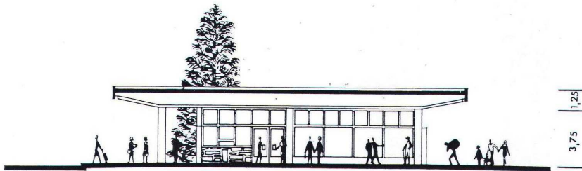
148. ábra. Az alsóörsi vasútállomás keresztmetszete