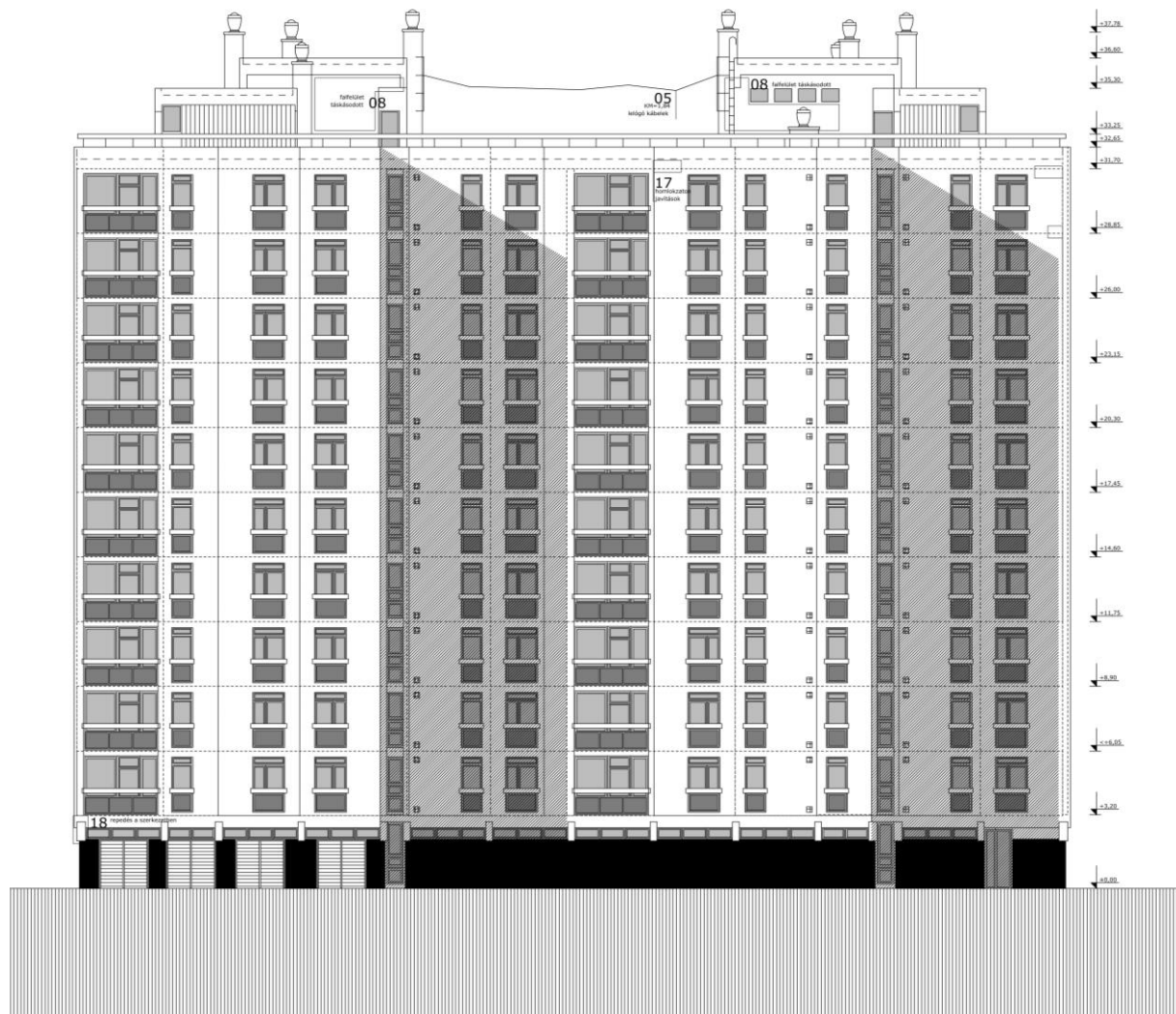
(Daróczi K., Goda L., Nagy E., Nemes I., Schott I. – Pécsi tízeemeletes panelos lakóépület épületdiagnosztikai felmérése)

A félèves feladat nem megfelelő minőségű prezentációja esetén automatikusan elutasításra kerül a félèves teljesítési lehetősége! Digitális adathordozón is be kell adni a félèves feladat összes munkarészét! (CD vagy DVD formátumban)