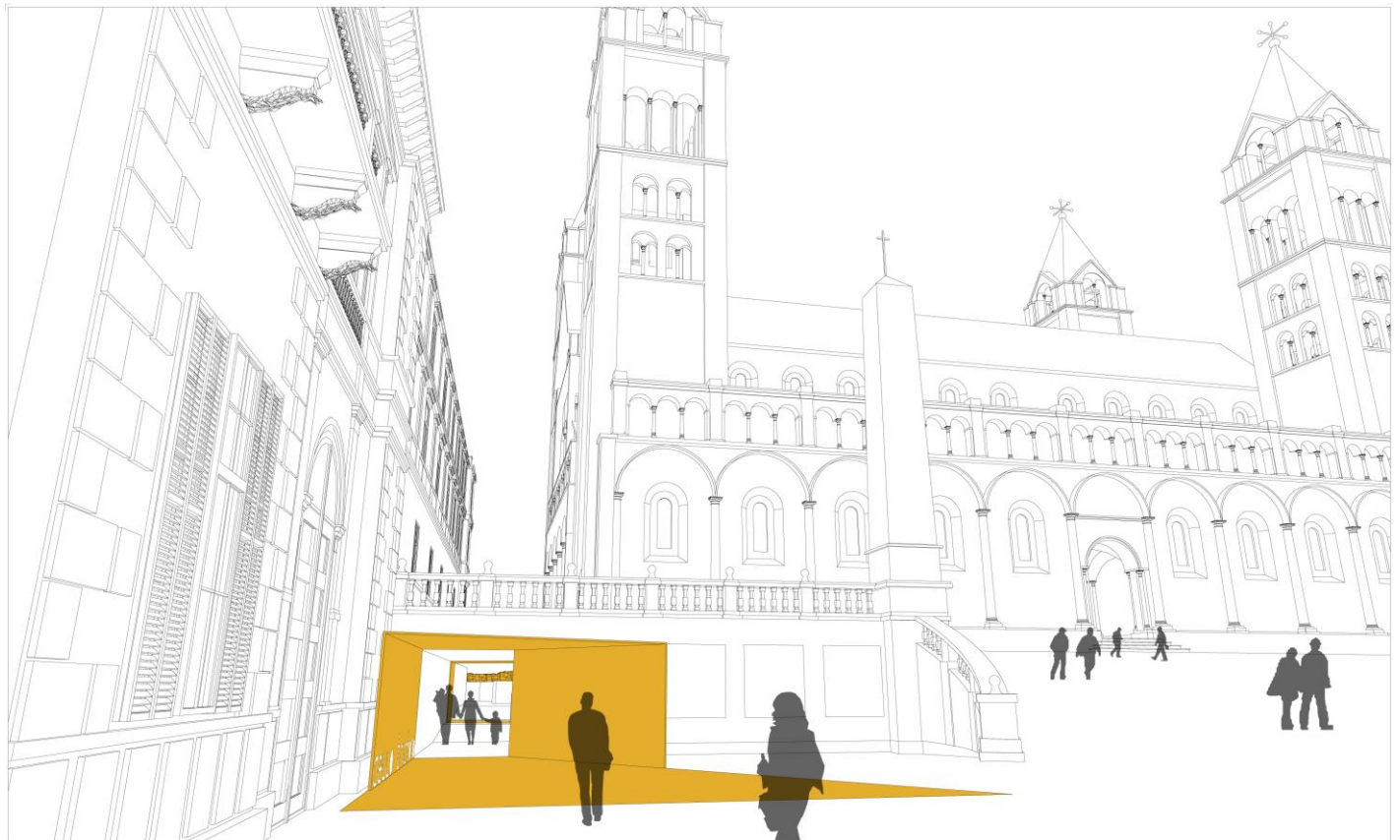
Cella Trichora - védelem és bemutatás Pécssett a Dóm téren

Beadási határidők, legkésőbbi benyújtás lehetősége, ideje stb.: vizsgaidőszakban későbbi meghirdetés szerint. A féléves időbeosztás úgy készült, hogy magában foglalja a TVSZ által kötelezően előírt késedelmes benyújtási lehetőséget.