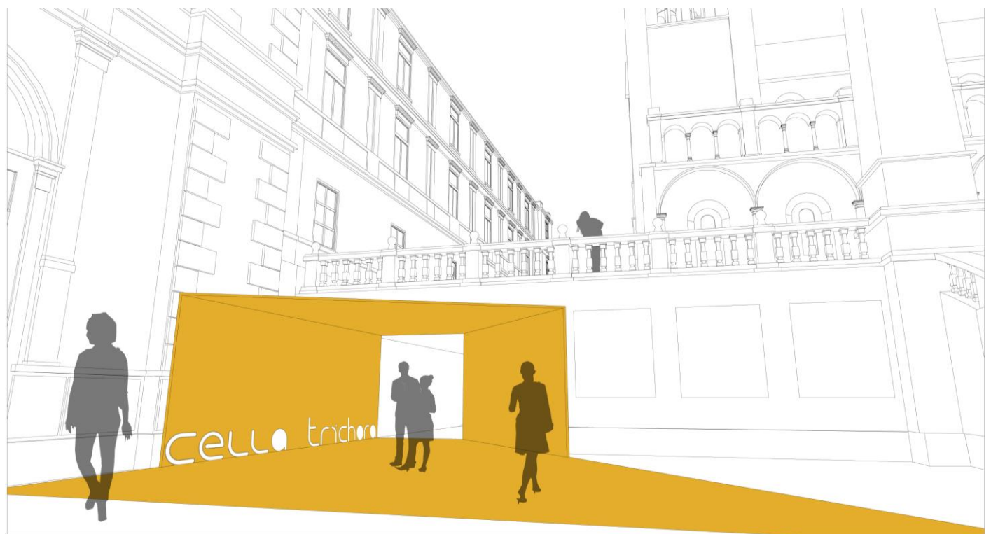
Cella Trichora - védelem és bemutatás Pécsen a Dóm téren

A hallgatók a félév során előadásokon, gyakorlatokon vesznek részt. A félév teljesítéséhez több lépcsős, és párhuzamos feladatokat kell megoldaniuk: