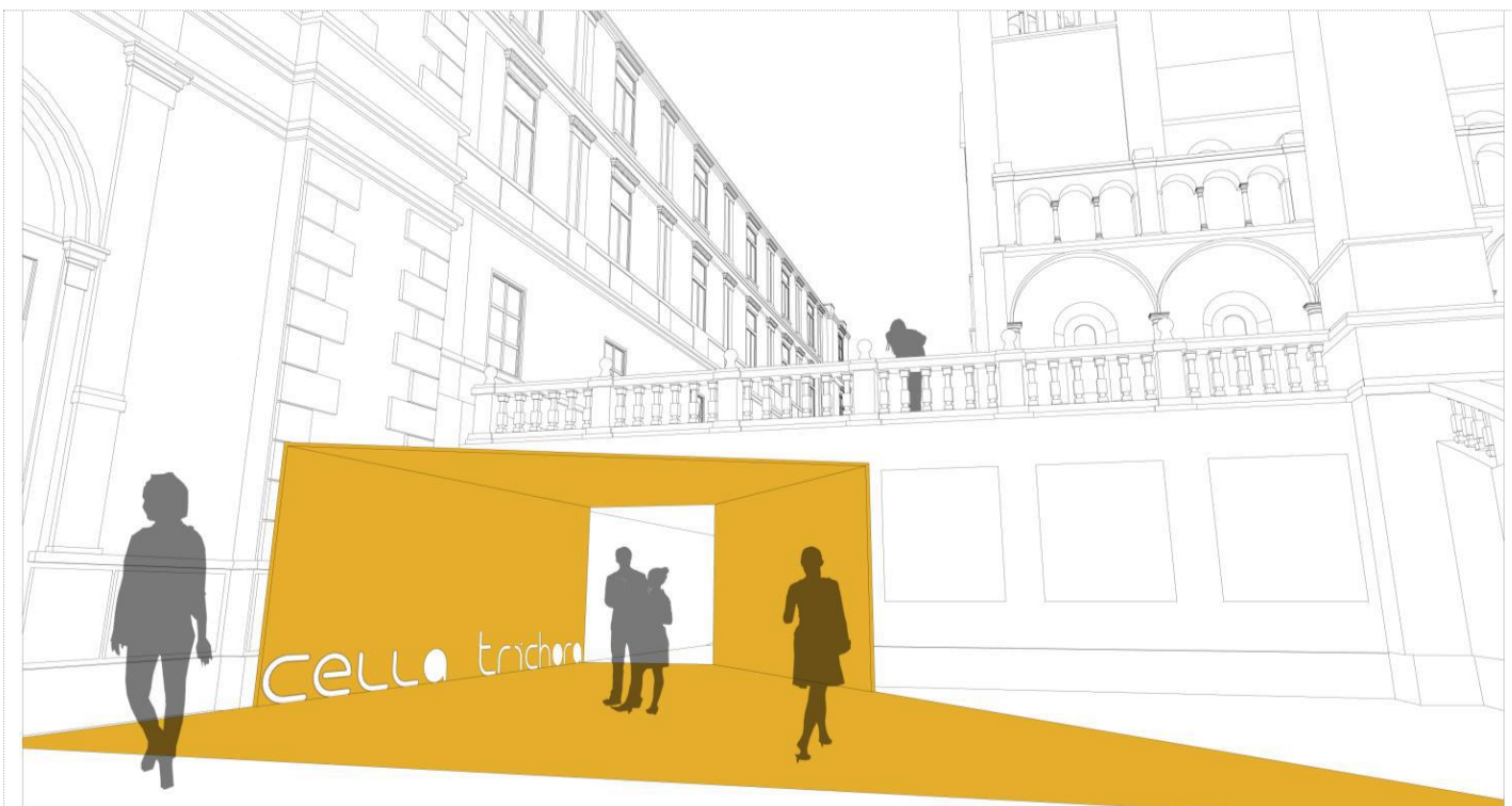
Cella Trichora - védelem és bemutatás Pécsen a Dóm téren