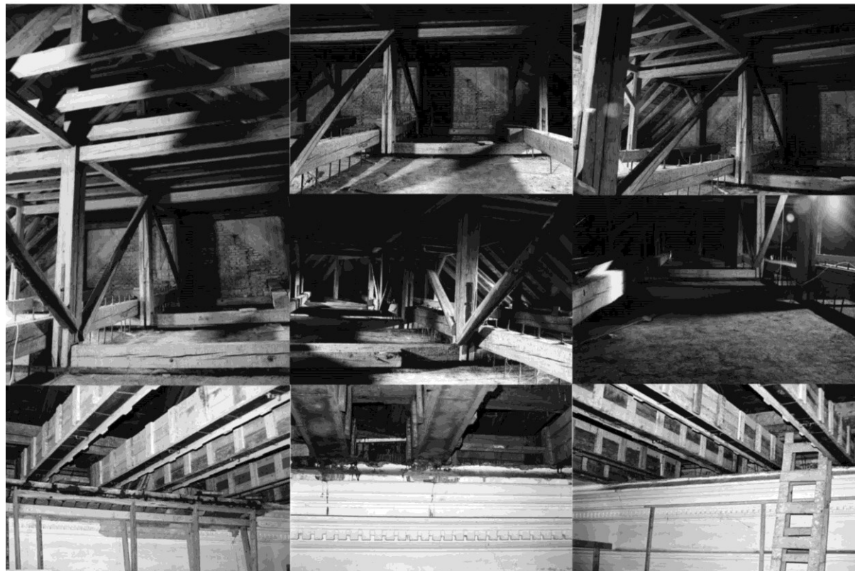
Dr. Horváth M., Turi Tamás: Dunaszentgyörgyi református templom épülete – helyreállítások

A hallgatók a 3 leadáson (és a javításain) a kihirdetett szempontrendszer teljesítésével és az órák látogatásával szerzi meg a jogot az aláírásra, a tartalmi szakmai bírálatra, tehát érdemjegy szerzésére. A kritériumok meglétét a mellékelt gyűjtőlapokon kerülnek regisztrálásra. Az a hallgató, melynek a kritériumok közül bármelyik is hiányzik a javítási lehetőségek után is, annak féltve nem teljesítettnek minősül, a tárgy aláírása megtagadásra kerül, a tárgyat egy későbbi szemeszterben újra fel kell vennie.