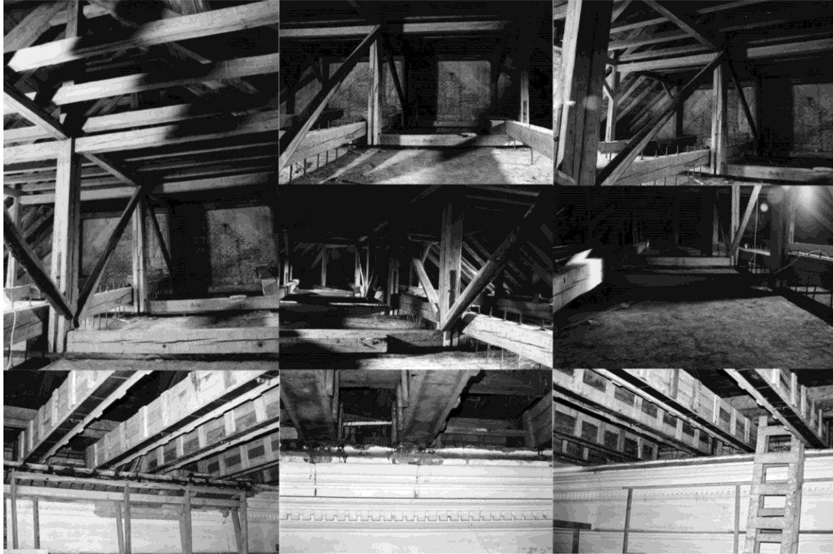
Dr. Horváth M., Turi Tamás: Dunaszentgyörgyi református templom épülete – helyreállítások

A hallgatók a 3 leadáson (és a javításain) a kihirdetett szempontrendszer teljesítésével és az órák látogatásával szerzi meg a jogot az aláírásra, a tartalmi szakmai bírálatra, tehát érdemjegy szerzésére. A kritériumok meglétét a mellékelt gyűjtőlapokon kerülnek regisztrálásra. Az a hallgató, melynek a kritériumok közül bármelyik is hiányzik a javítási lehetőségek után is, annak féltve nem teljesítettnek minősül, a tárgy aláírása megtagadásra kerül, a tárgyat egy későbbi szemeszterben újra fel kell vennie.